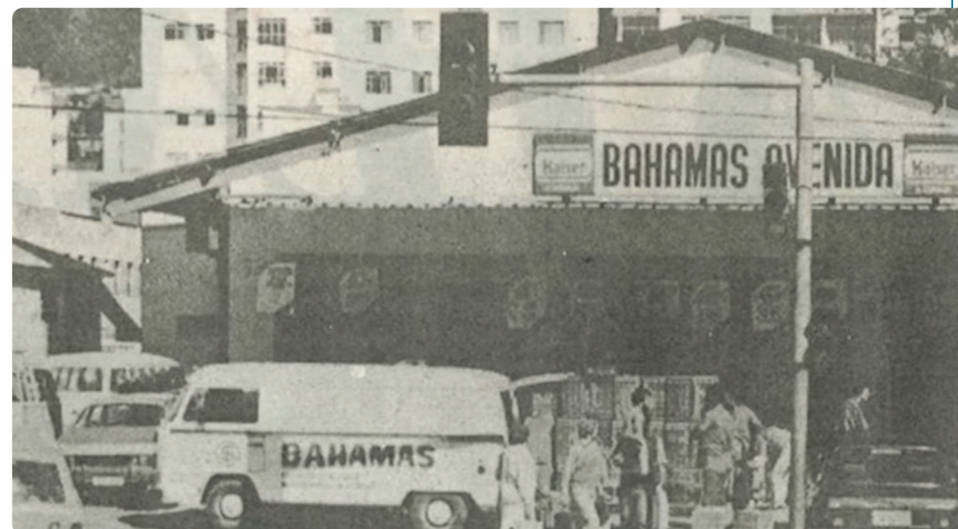
O Bahamas se populariza em 1988 a partir da inauguração da unidade na Avenida Rio Branco, o principal corredor de tráfego de Juiz de Fora